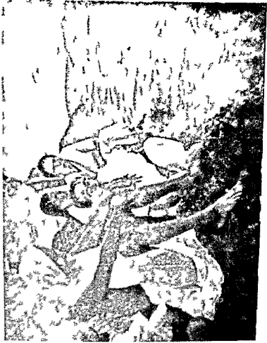
बयाकुमारीला सागराच्या सातव्यात गिळवर बसून, भारतात ग्रामस्वराज्याची स्थापना हाभीपमत अखंड पदयात्रा चालू ठवण्याची प्रतिज्ञा करीत असताना